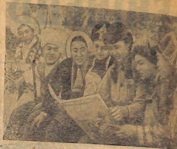
У Китайській Народній Республіці живе біля 60 мільйонів людей. Центральний народний уряд створив ряд вищих навчальних закладів, які готують кадри спеціалістів для автономних районів населених національними меншостями. На знімку: група студентів-представників молоді національностей аїні, лі розглядають ілюстрований журнал.