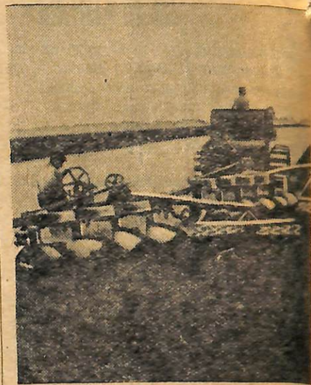
На знімку: оранка під озими.