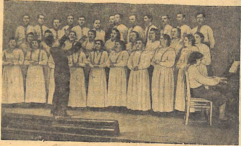
Вінницька область. Часто виступає перед трудящими м. Тульчина, а також в сільських клубах хор районного Будинку культури. Цей хор створений ще в перші роки радянської влади відомим українським композитором Миколою Дмитровичем Леонтовичем. На знімку: виступ хору.

У РАДІ МІНІСТРІВ УКРАЇНСЬКОЇ РСР Рада Міністрів Української РСР постановила: призначити Інститут фізіології імені О. О. Богомольця Академії наук УРСР.