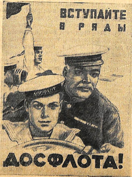
Плакат роботи художника Б. Зелінського, випущений видавництвом «Искусство».