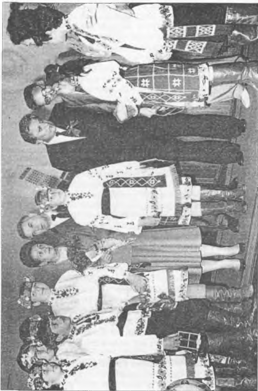
Прямно поспілкуватися з Міністром освіти