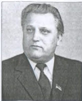
Міністр освіти Української РСР М. В. Фоменко

– Найбільше турбувала проблема вчительських кадрів, поліпшення якості їх підготовки. Без кваліфікованого вчителя годі й думати про підвищення рівня навчання і виховання учнів у школах. Це – аксіома. Тоді ще значна частина вчителів не мала педагогічної освіти. Збільшити кількість учителів не давали змогу слабкі бази педінститутів і педучилищ. Багато навчальних корпусів педінститутів збудовано саме в той період. Для цього, крім додаткових капіталовкладень, які виділяла держава, використовувались усі можливі шляхи: добудови, передача приміщень, навіть будівництво за рахунок коштів, що виділялись для шкіл. І це дало свої результати. Навчальні заклади і університети направляли до шкіл майже 30 тисяч учителів, поліпшилось забезпечення їх квартирами, підвищилася заробітна плата. В школах уже не було педагогів із загальною середньою освітою.