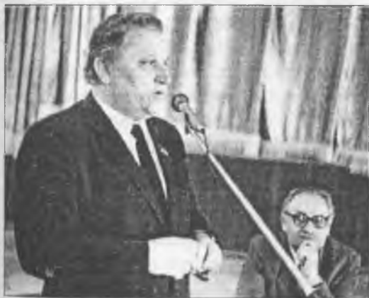
Біля мікрофона Міністр освіти УРСР

Лише упродовж 1976-1980 років учителі сільських шкіл одержали понад 54 тис. квартир, більшість з яких – за рахунок колгос-