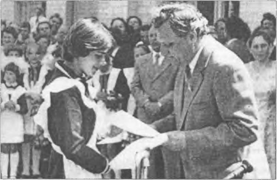
Михайле Володимировичу, а що ви скажете про написане?

ли з трибуни не читав. Ще й досі, як легенду, згадують його звичку зустрічатися ледве не з кожним потоком слухачів, що підвищували кваліфікацію в Центральному інституті удосконалення вчителів у м. Києві.