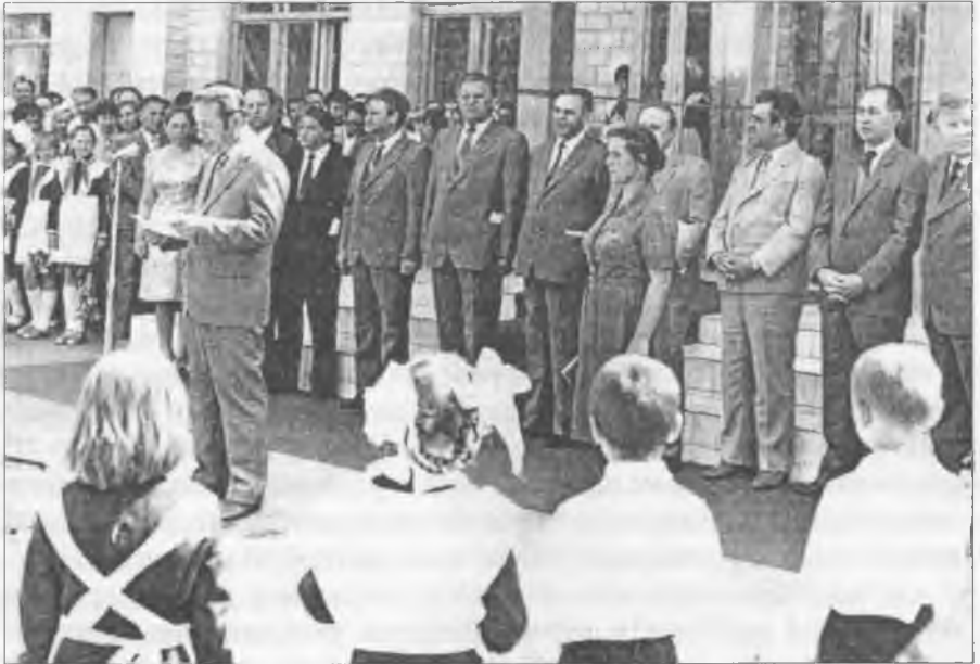
На першOVERесневій шкільній лінійці

Було визначено й організаційні форми цієї роботи, зокрема, «індивідуальні: самоосвіта, стажування, наставництво, консультації; колективні: постійно діючі – шкільні і районні (міські) методичні об'єднання, опорні дитячі дошкільні заклади, школи передового педагогічного досвіду, семінари, творчі групи; періодичні – педагогіч-