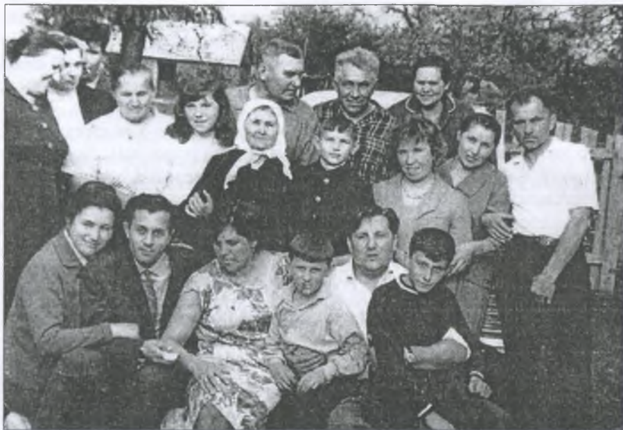
Великий рід Кикосів

зрізати або собі порізати на городі огірочок чи грушку у садку, зубів не було років з 50-53-х.