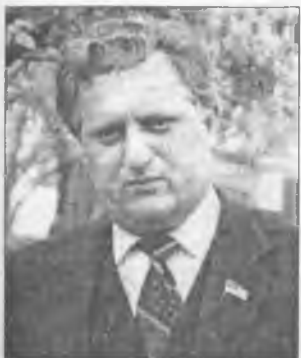
Задуманий і засереджений Міністр освіти УРСР

Проводили значну роботу з підлітками на підприємствах, за місцем проживання, у профспілкових клубах. На великих підприємствах відкривали підліткові клуби юних техніків, зокрема, на таких промислових гігантах, як «Арсенал», Харківський тракторний, Краматорський машинобудівний заводи, «Запоріжсталь» та ін. При житлово-експлуатаційних конторах також відкривалися клуби, кімнати школярів. Там запроваджували штатні посади педагогів і керівників гуртків. Лише технічною творчістю в республіці займалося 800 тис. учнів.