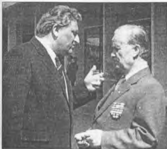
Відверта розмова Міністра освіти з ветераном війни і праці

ратури для дітей і юнацтва». Була надрукована серія методичних посібників для вчителів-словесників, розпочалися телевізійні олімпіади з української мови, виходить у світ багатотисячними тиражами у здешевленому варіанті серія книжок «Шкільна бібліотека», що включала твори українських письменників, включених до шкільних програм. До речі, книжки цієї серії у