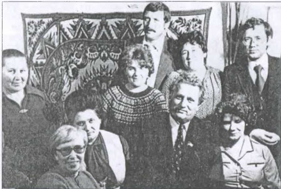
В колі рідних