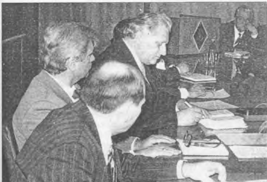
У Донецькому національному університеті

За оперативними даними, навчання розпочали 6,9 млн. школярів, 600 тис. учнів профтехучилищ. 140 тис. студентів педагогічних вузів, 57,4 тис. учнів педагогічних училищ та індустріально-педагогічних технікумів денної форми навчання. В інтернатних закладах виховується 160,0 тис., в дошкільних установах – 2,6 млн. дітей. Підготовлено 31,7 тис. молодих спеціалістів, в т.ч. 120 практичних психологів.