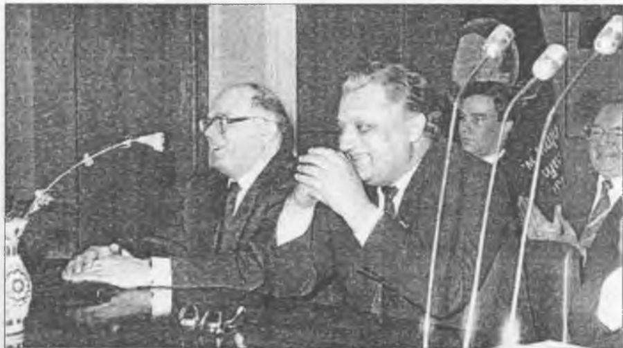
На врученні прапора НДІ педагогіки УРСР. Київ. 18.02.1986 р.