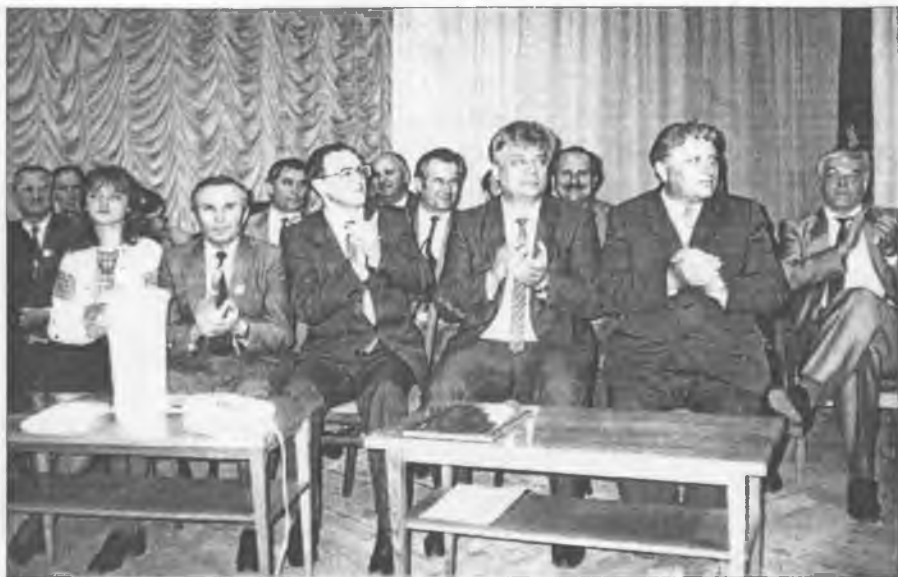
В Івано-Франківському педагогічному інституті

лі і професії, за якими здійснювалася підготовка учнів зазначених шкіл (класів), визначалися рішенням виконавчих комітетів місцевих рад народних депутатів і відділів народної освіти відповідно до переліку професій і з урахуванням потреб народного господарства в кадрах, наявності навчально-матеріальної бази, кваліфікованих кадрів, які мали забезпечувати навчання і, що найголовніше, повинні були «реалізуватися, як правило, на базі промислових підприємств, обчислювальних центрів, фізичних і хімічних лабораторій, сільськогосподарських підприємств, художніх майстерень, науково-дослідних інститутів, вищих навчальних закладів та інших організацій у районі». Для цього суб'єктів господарської діяльності закріплювали за школами як базові підприємства.