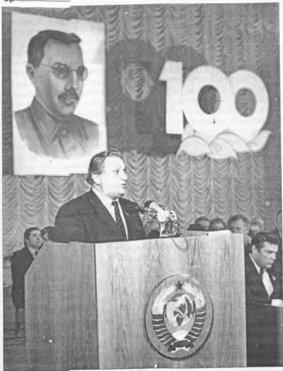
На урочистому засіданні з нагоди 100-річчя від дня народження А. С. Макаренка