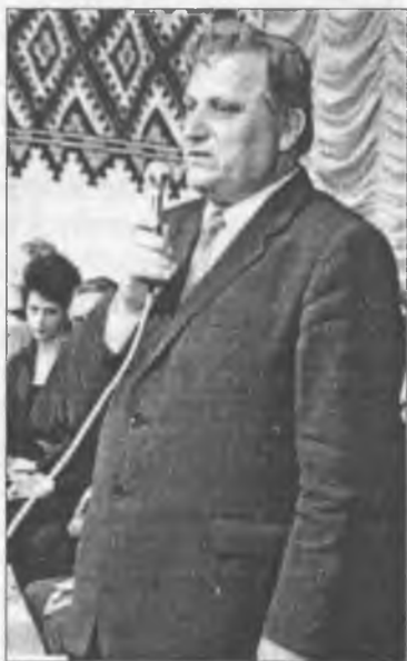
Міністру завжди було що сказати нового працівникам освіти

Організатором і фактичним керівником розбудови мережі закладів освіти були Міністерство на чолі з М. В. Фоменком, відділи освіти в областях, містах і районах, які виконували функції замовника будівництва переважної більшості освітянських об'єктів, здійснювали контроль за новобудовами, що споруджувалися силами колгоспів, радгоспів та інших суб'єктів господарювання, постачало новобудови меблями, навчально-наочним обладнанням та всім необхідним для нормального функціонування закладів освіти.