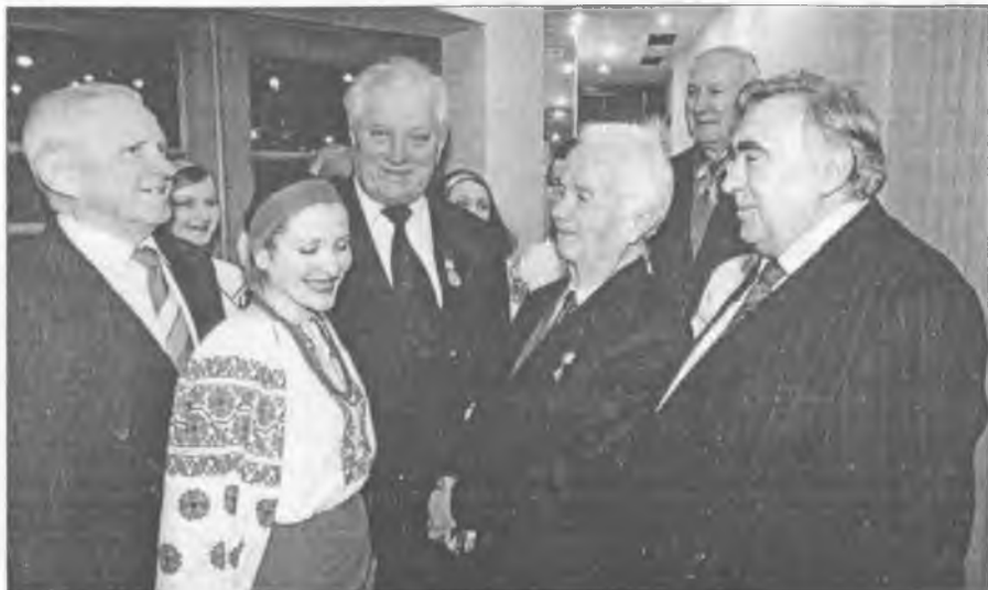
Присміє спілкування з друзями та молодіу Україною

плани і програми в загальноосвітніх школах. 25 грудня 1985 р. прийнято окреме рішення колегії, яким було передбачено комплекс заходів, спрямованих на розв'язання цієї проблеми. Особливу увагу приділено підготовчій роботі, яку мали провести Міністерство та підпорядковані йому структури.