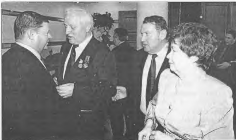
Є що згадати давнім друзям

Швидко пішов ти по службі – Сходинки тернисті. З Гуляйпільщини один ти Вийшов у міністри.