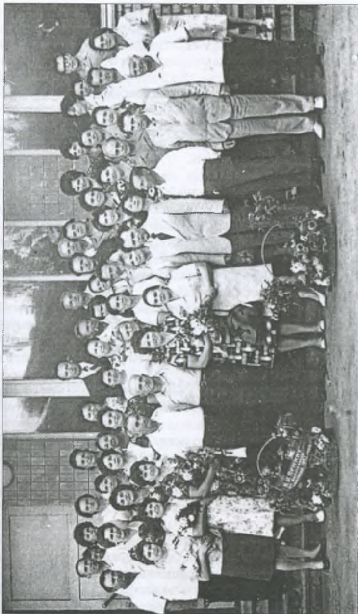
Зустріч випускників різних років Гуляйпільського педагогічного училища