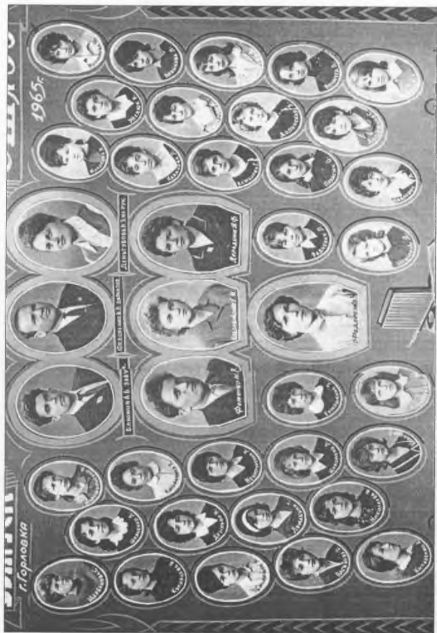
Випуск учнів 11-го класу Горлівської СШ № 55. 1965 р.