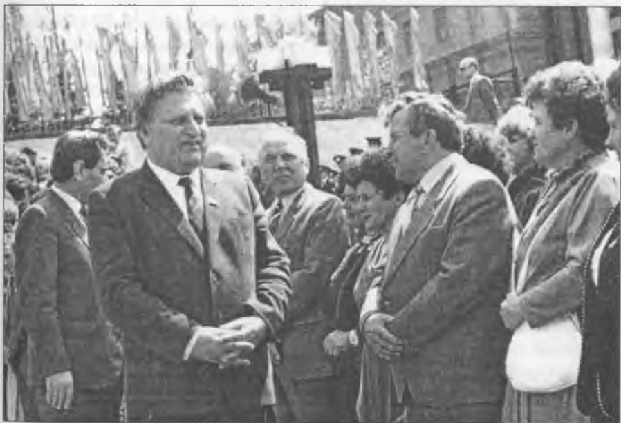
У спілкуванні з колегами Міністр черпав силу і натхнення

Колегія міністерства, ректорати педвузів вживали заходів щодо ліквідації недоліків і у професійній підготовці вчителів. Це, поперше, вдосконалення навчального процесу. Шляхом інтегрування навчальних курсів були вивільнені години для поглибленого вивчення психолого-педагогічних наук. По-друге, посилення виховної роботи; по-третє, підвищення професійного рівня викладачів вузів; по-четверте, вдосконалення зв'язків із школами і професійно-технічними училищами.