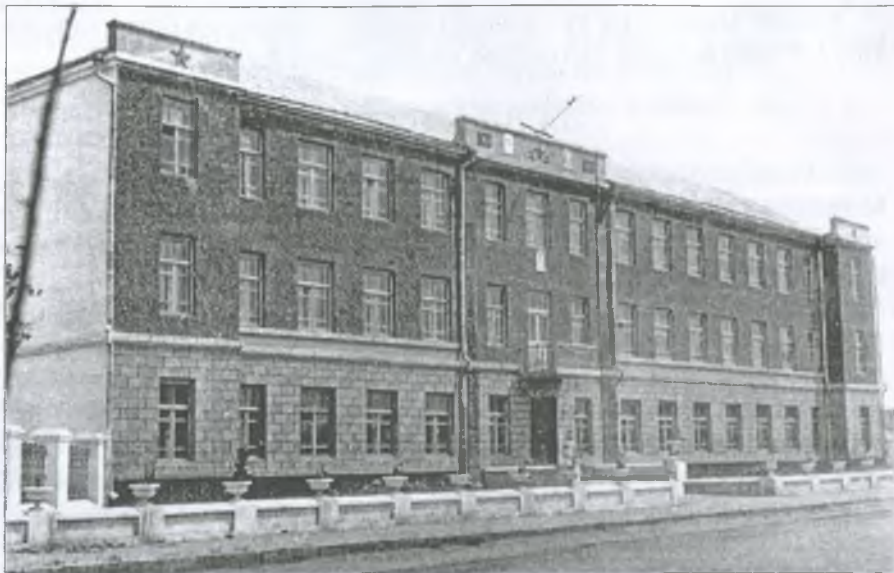
Гуляйпільський педтехнікум. 1938 р.

навчали їх 4 викладачі. Завдання перед технікумом стояло цілком конкретне: за три роки підготували вчителів початкових класів. Заняття в ньому розпочалися у листопаді.