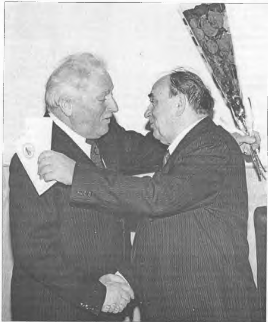
З ювілеєм, друже!