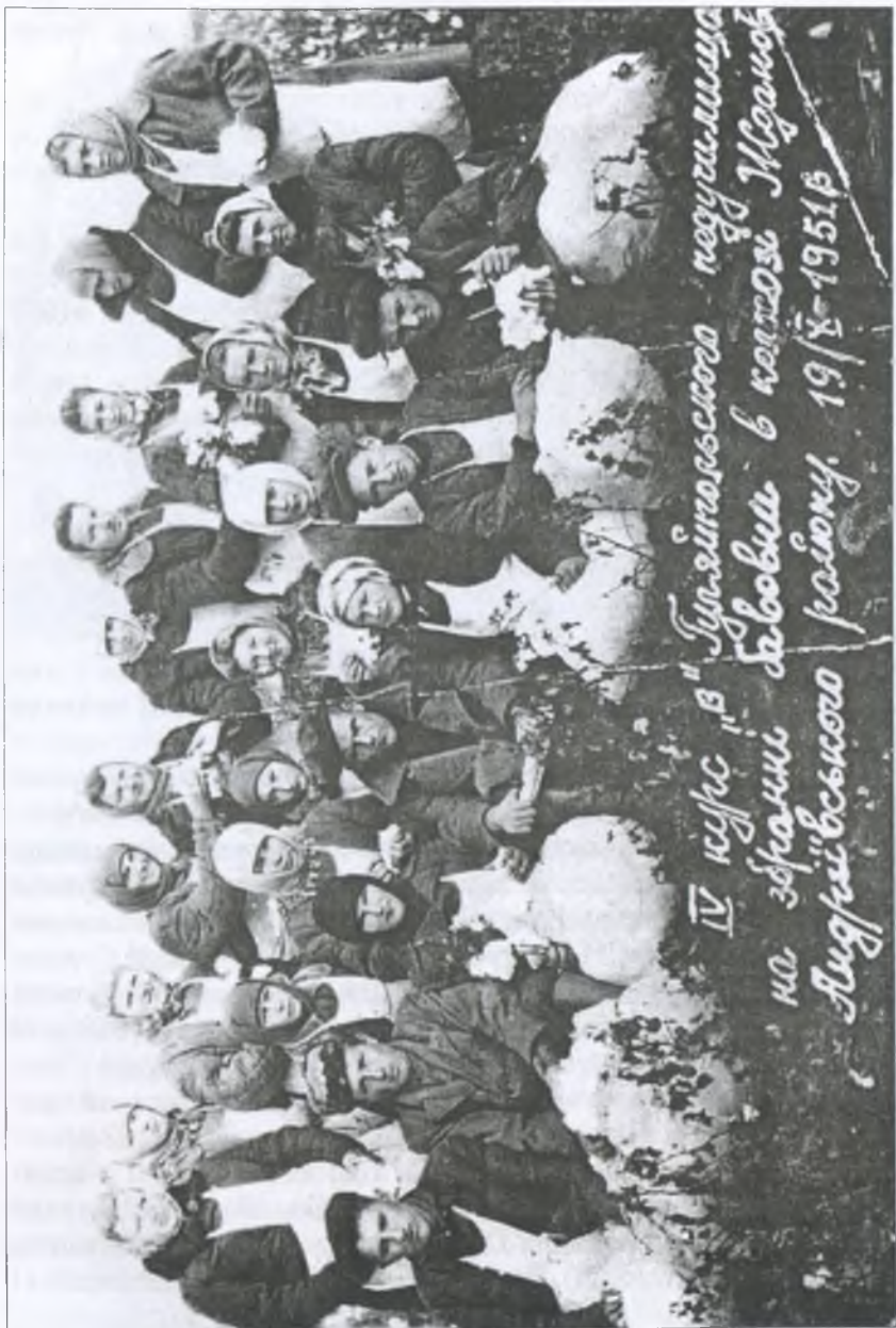
Студенти педучилища в колгоспі. 19.X.1951 р.