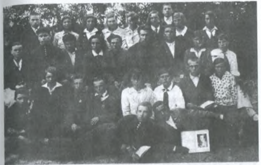
Випуск Верхньотерсянської семирічної школи. 1938–1939 рр.

За планом культурно-масової роботи в бригаді проходить вивчення матеріалів XVIII з'їзду ВКП(б), бесіди про міжнародне становище, технічне і агротехнічне навчання. Часто трактористи