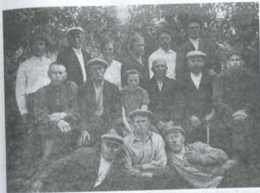
Група активістів села. 1932 р.