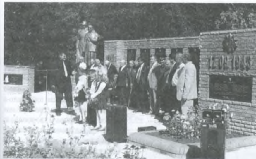
Відкриття реконструйованого меморіалу в центрі с. Верхня Терса. 2004 р.

Ігор Олексійович вручив першокласникам на пам'ять сувеніри – альбоми на 200 фотографій.