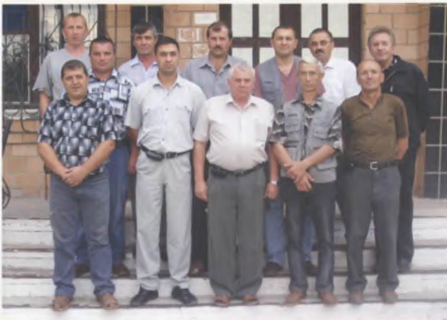
Колектив спеціалістів ТОВ «Агро-Континент»