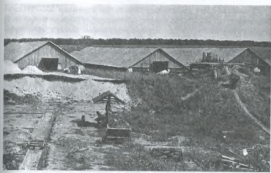
Завод з виробництва цегли колгоспу імені Леніна. 1959 р.

Завдяки самовідданій праці колективу тваринників колгосп у 1964 році достроково виконав план продажу м'яса, молока, яєць і вовни державі і виробив з розрахунку по 100 гектарів сільгосп-