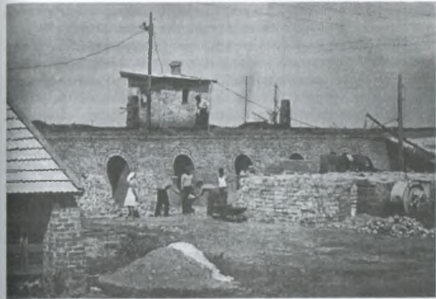
Виробничі процеси в цегляному заводі

Завдяки наполегливій праці колгоспників господарство відзначалося високими і сталими врожайями. Швидко розвивалося громадське тваринництво.