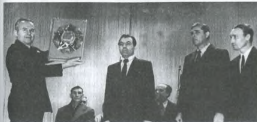
Вручення почесного знака ЦК КПРС, Ради Міністрів, ЦК ВЛКСМ ордена Леніна колгоспу імені Леніна – переможцю 10-ї п'ятирічки

Щиро вітаємо весь колектив господарства з високою відзнакою. Висловлюємо тверду впевненість у тому, що колгоспники орденоносного господарства доб'ються нових звершень у піднесенні сільськогосподарського виробництва, успішно виконають завдання і зобов'язання третього року й одинадцятої п'ятирічки в цілому».