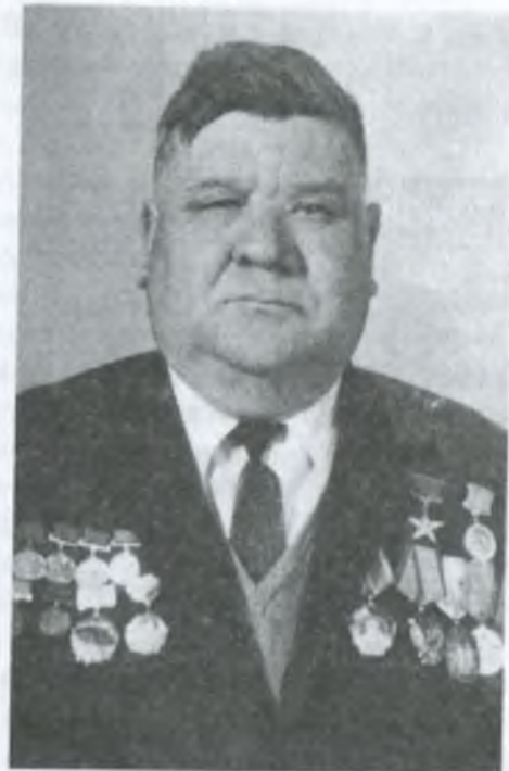
Герой Соціалістичної Праці Зачепило Олександр Олександрович

До Івана Полікарповича Мартиненка в колгосп «Заповіт Леніна» Зачепило їздив разом зі своїми хлопцями, замазученими, пропахлими соляркою і степом механізаторами. Приїздили, придивлялися, розпитували, а робили по-своєму, так би мовити, позачепилівському. І непогано виходило. На культивації робочі органи, змайстровані бригадними умільцями із доліт та прополкувальних лемешів, зрізували геть чисто бур'яни, і ґрунт підпушували. Не гірше, ніж у Мартиненка. А жнивуть – то усе роблять, аби якнайліпше, до зернини врожай зібрати. Уродиться хліб густий та високий, то на півжнивварки беруть, та на зменшених передачах з прикритим газком. Валок тоді рівенький, комбайном чи не до стеблини підбирається. А на комбайнах додаткові зерновловлювачі поставили. І знову ж таки висієш вчасно – родить рясно, як