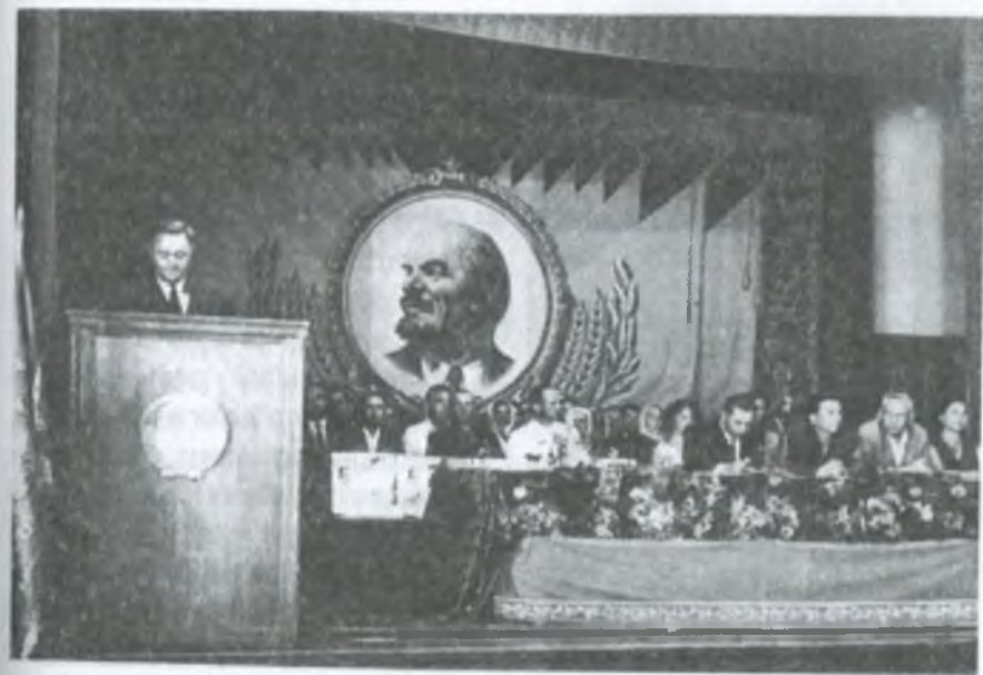
В президії на святковому вечорі під час вручення колгоспу ордена Леніна

Висока урядова нагорода – дана була колективу не тільки за успіхи останніх років. Вагому частку внесли трудівники сільгоспартілі ще в 1933, сорок першому, сорок четвертому, сорок