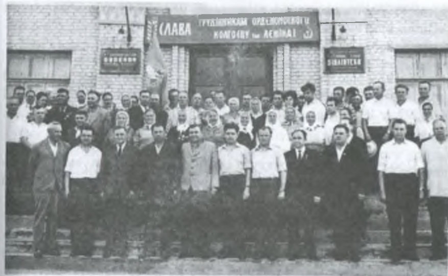
Група керівників району та області серед колгоспників колгоспу імені Леніна

Гарним помічником правління колгоспу та партійної організації була колгоспна багатотиражна газета «Ленінець» – орган