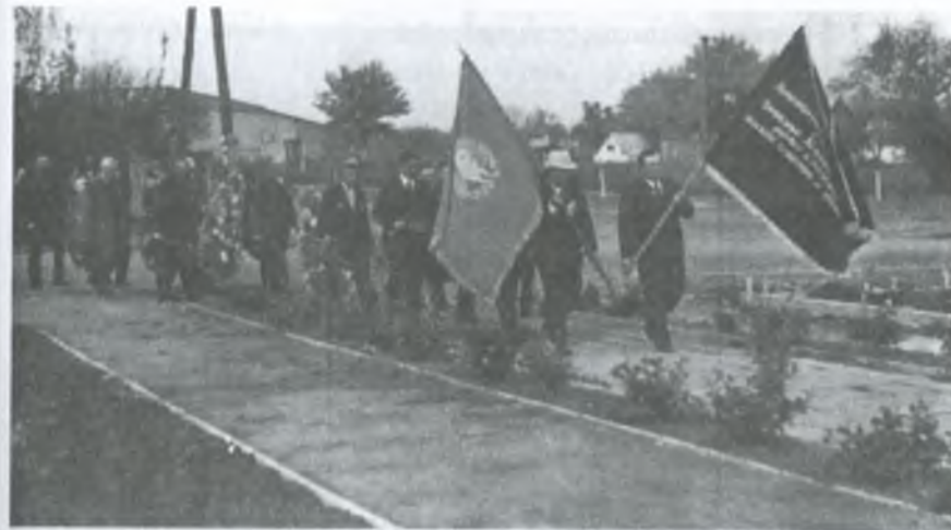
Святкова хода на честь Дня Перемоги. 9 травня 1976 року, с. Верхня Терса

За вісім місяців річний народногосподарський план заготівлі молока виконано на 71 відсоток. За цей час здійснено річні зобов'язання по продажу державі м'яса і вовни.