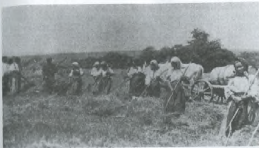
Колгоспники на сінокосі

5 жовтня артіль «Комунар» на площі 890 гектарів закінчила підняття зябу, кооперації продала 2100 центнерів хліба, на який буде куплено дві автомашини (одна вже куплена). Колгоспники