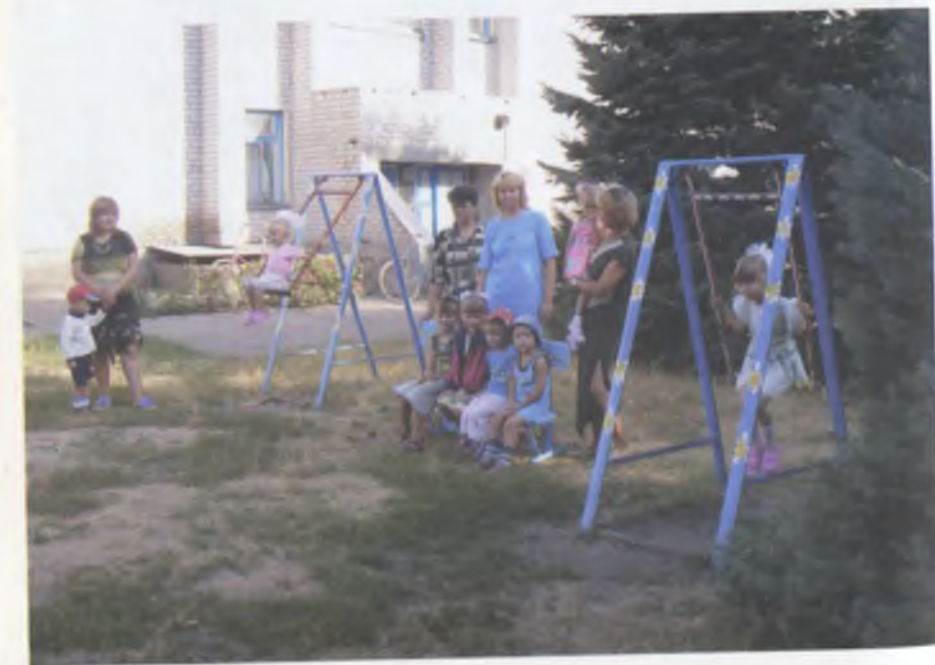
Дитячий садок: колектив вихователів з дітьми