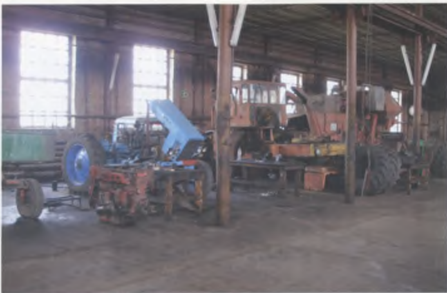
Механічна майстерня тракторної бригади