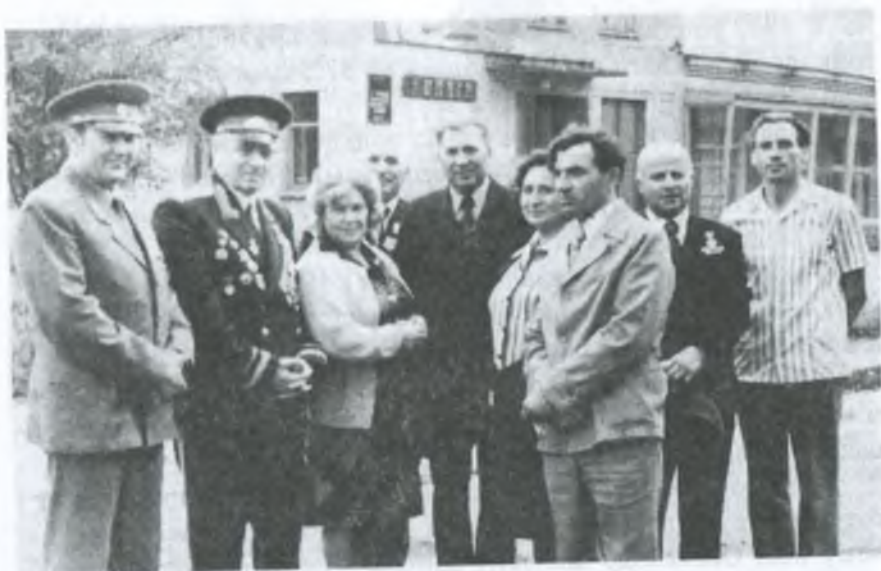
Група воїнів-визволителів у селі Верхня Терса. 1983 р.

раз був призером районних оглядів художньої самодіяльності, виступав на сценах обласного центру.