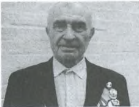
КИРИЛЕНКО Олексій Володимирович