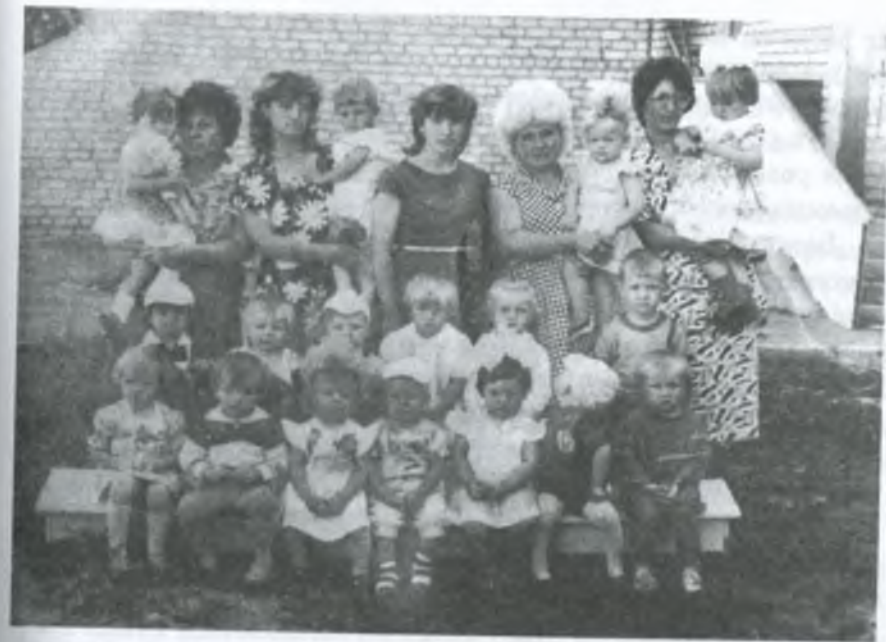
В дитячому садочку «Сонечко». 1990 р.

Однак навіть за цих умов комітет профспілки колгоспу імені Леніна виробляє основні напрямки своєї роботи і прагне чітко