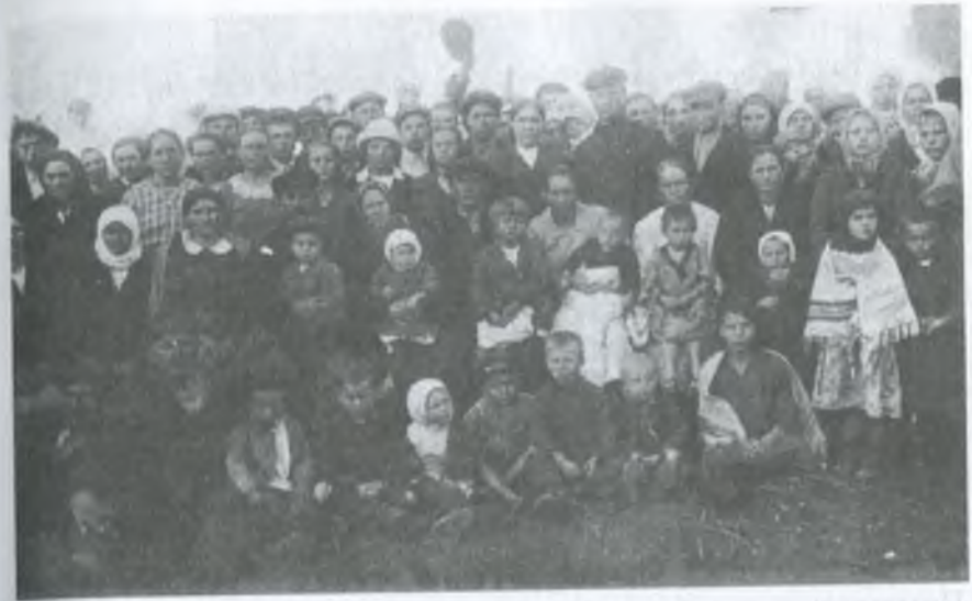
Перші збори колгоспників

Зібравшись на нараду напередодні зльоту, колгоспники заявили: «Оскільки «Комунар» на сьогодні має честь бути в шерензі передніх господарств і запрошується учасником на районний зліт передових колгоспів, цю перемогу на фронті будівництва великого соціалістичного господарства ми зобов'язуємося три-