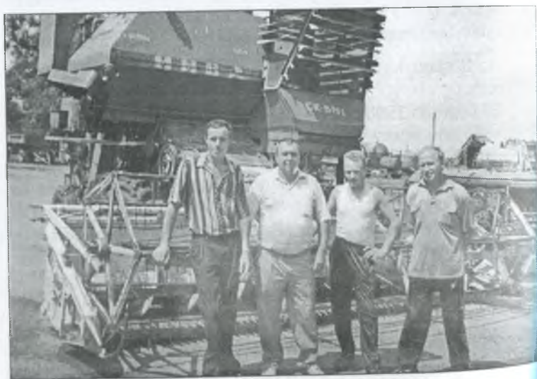
Збирання врожаю у ТОВ "Рівнопілля"