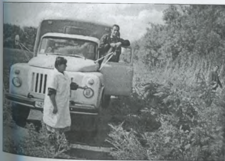
Кухарі привезли обід у поле механізаторам