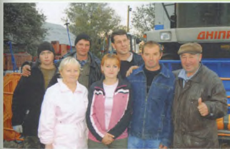
Колектив автогаража та харчоблоку