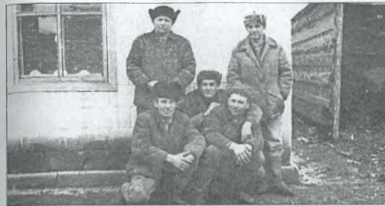
Члени тракторної бригади № 4 колгоспу імені Енгельса, 1978 р.