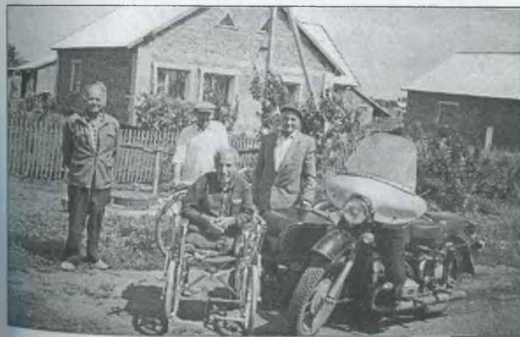
Вулиця Нова с. Рівнополлє. 1994 р.