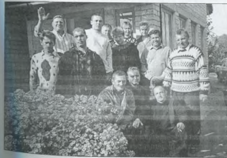
Спеціалісти товариства. 1999 р.