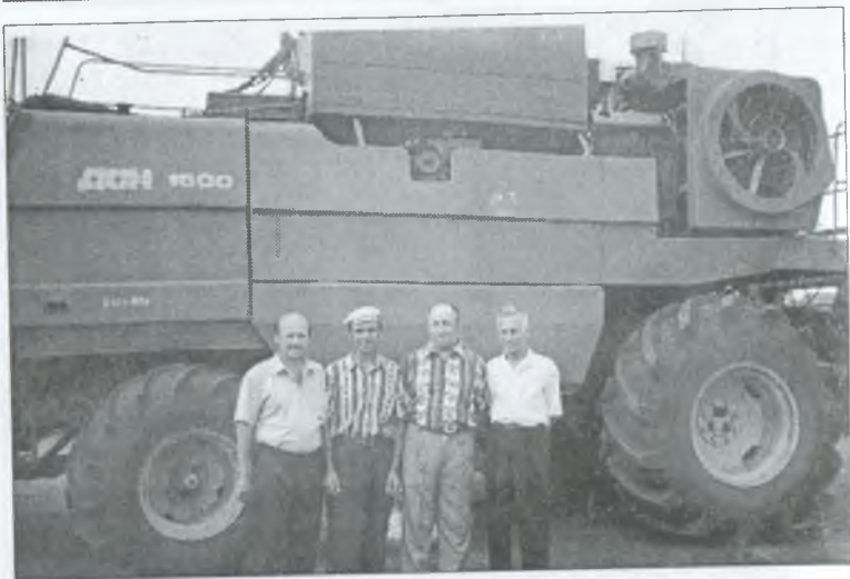
Екіпаж на жнивях — 2000 р.