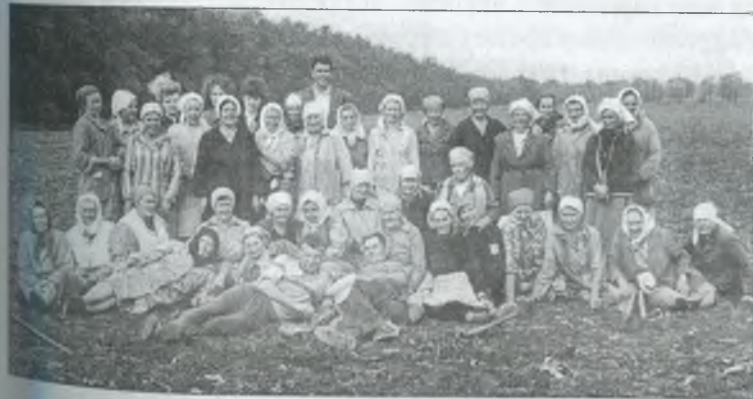
У полі дружною сім'єю. 1993 р.