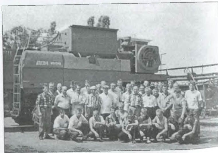
Підбиття підсумків збирання врожаю 1999 р.