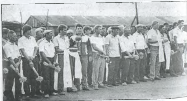
Проводи на жнива. 1989 р.

Чотирнадцять осіб за рахунок господарства навчаються у вузах і технікумах, а ще шістнадцять — у профтехучилищах. Числене поповнення чекає колгоспна сім'я.