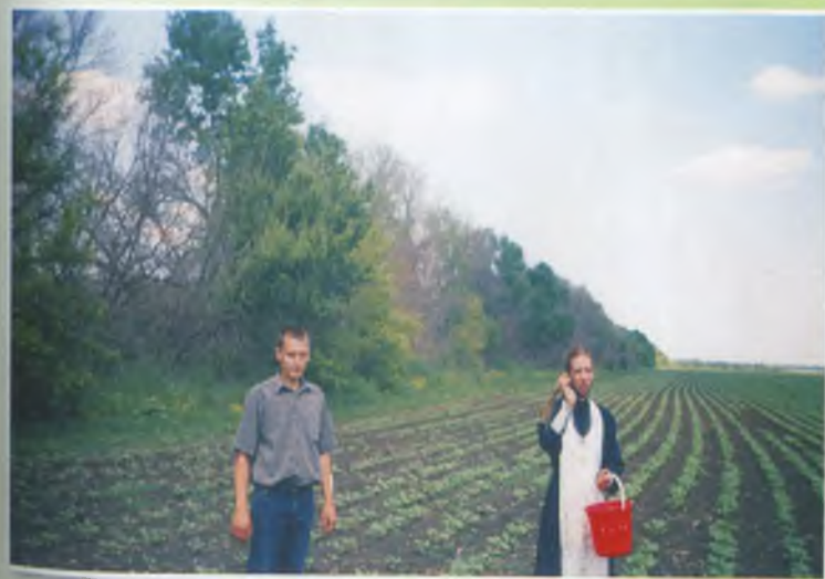
Освячення полів ТОВ "Агро-Рівнопілля"