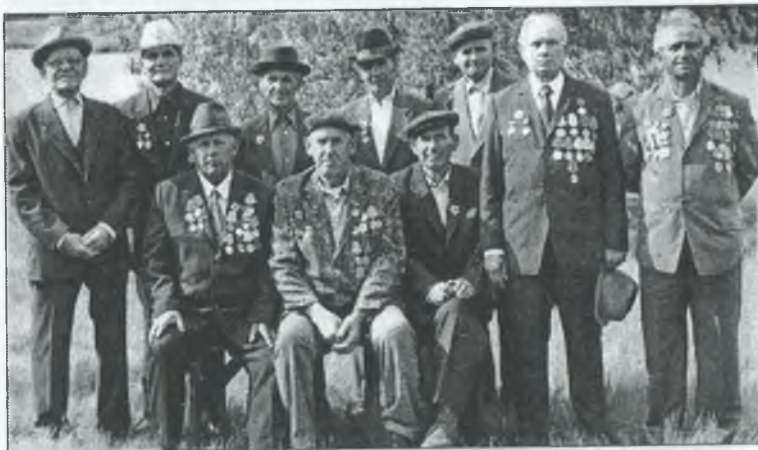
9 травня 1990 року. Ветерани Великої Вітчизняної війни