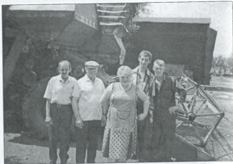
Передовий екіпаж на збиранні зернових