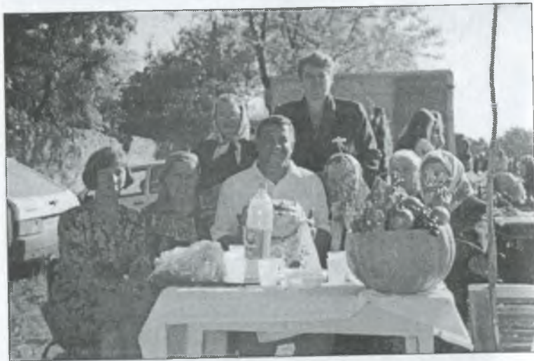
Святкування дня міста Гуляйполя. 1998 р.