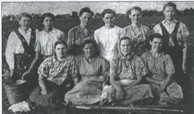
с. Рівнопілля. Рільнича бригада колгоспу ім. Кагановича. 1951 р.