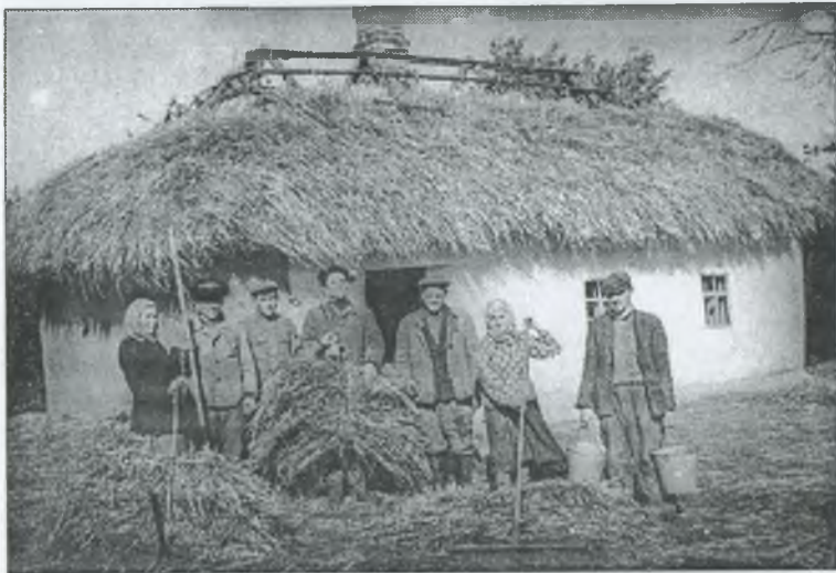
Хата збудована в 1928 році.