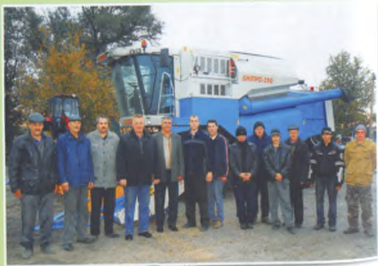
Колектив тракторної бригади