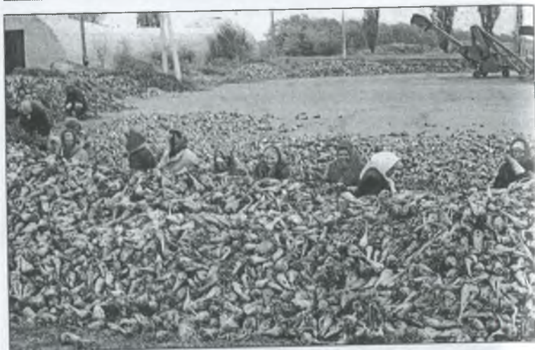
Пенсіонери за роботою. 2005 р.