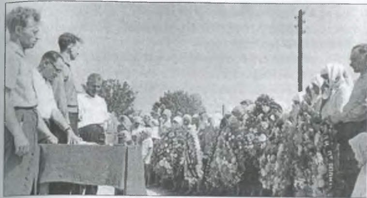
Відкриття пам'ятника загиблим у с. Рівнопіллі

В 1962 році у Яблуковому відкрили поштове відділення, яке в 1977 році перенесли в Рівнопілля.