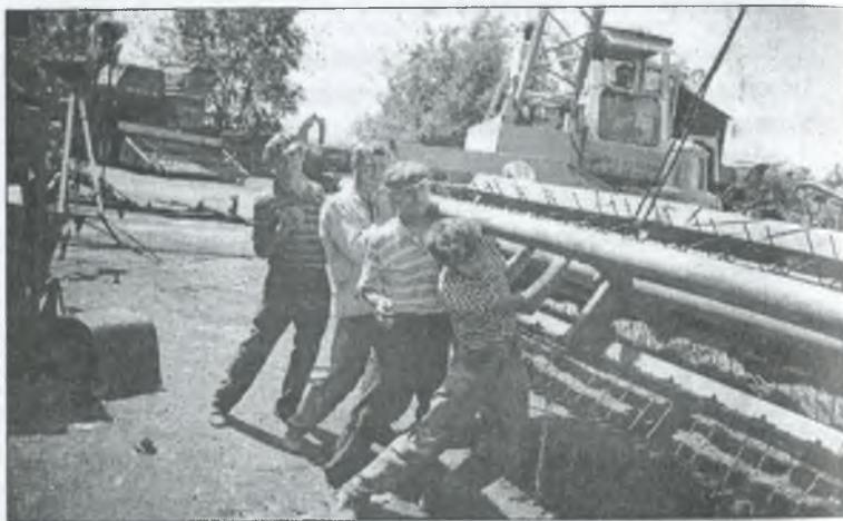
Підготовка до жнив у ТОВ "Рівнопілля"

В 2000-му році господарство використало 35,2 тонни бензину (вартість однієї тонни — 1650 грн.), дизпалива — 155,2 тонни (вартість однієї тонни — 1600 грн.). Це 18 місце в районі.