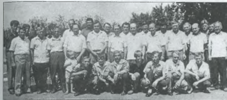
Під час підсумків жнив — 93