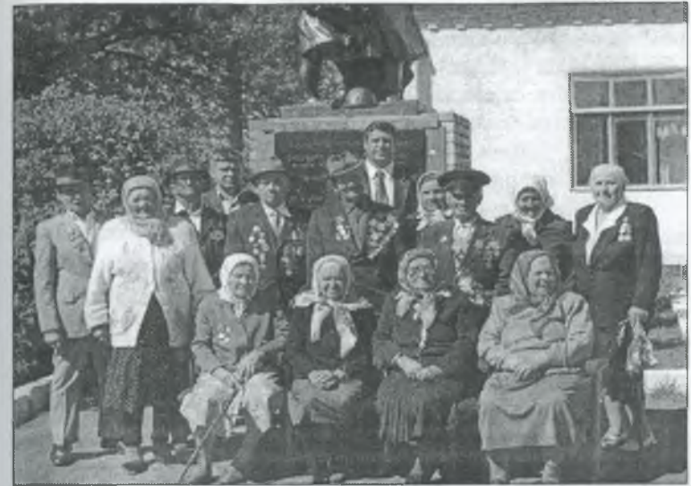
Ветерани та вдови Великої Вітчизняної війни. 9.05.2002 р.