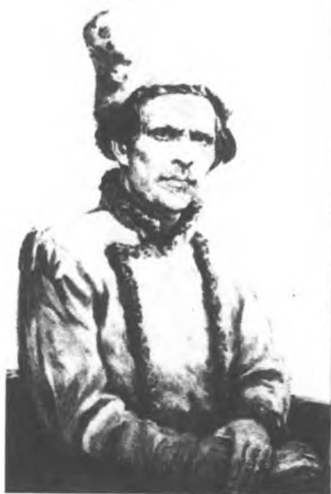
Невеселі думи Нестра Махна. Що далі робити?