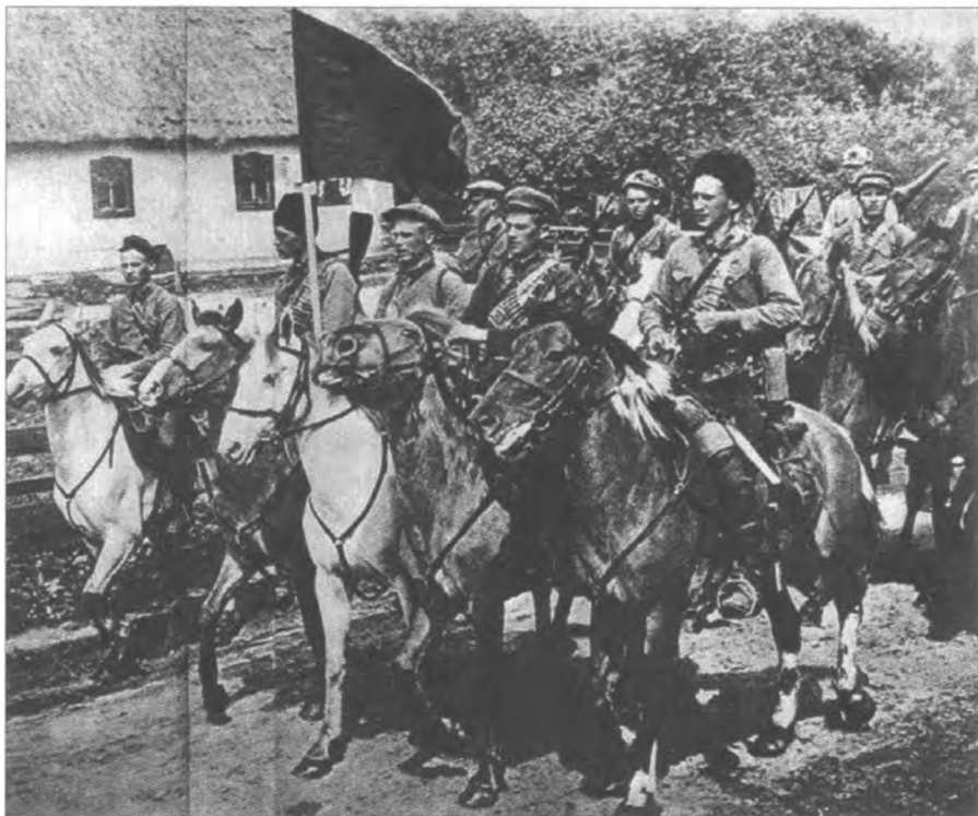
Махновський загін. 1918 р.