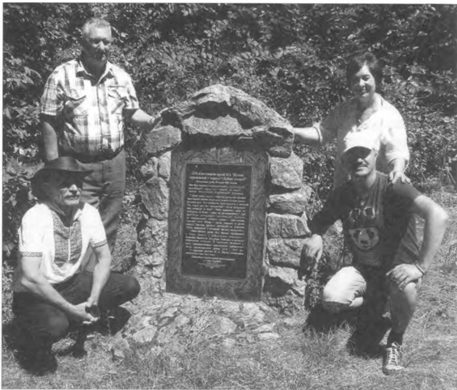
Гуляйпільці в Дібрівському лісі. 2017 р.

(Дібрівки), про перемогу невеликого загону над загарбниками, відступ і поразку. Звідси, стверджують автори, і почався шлях боротьби Револьюційної Повстанської армії України (махновців) під керівництвом Нестора Махна.