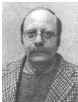
Французький історик Олександр Скирда м. Париж. 2002 р.

Функції членів секції зводились до організації шкільної справи, вишукування коштів для роботи навчальних закладів, шляхом залучення до цього батьків