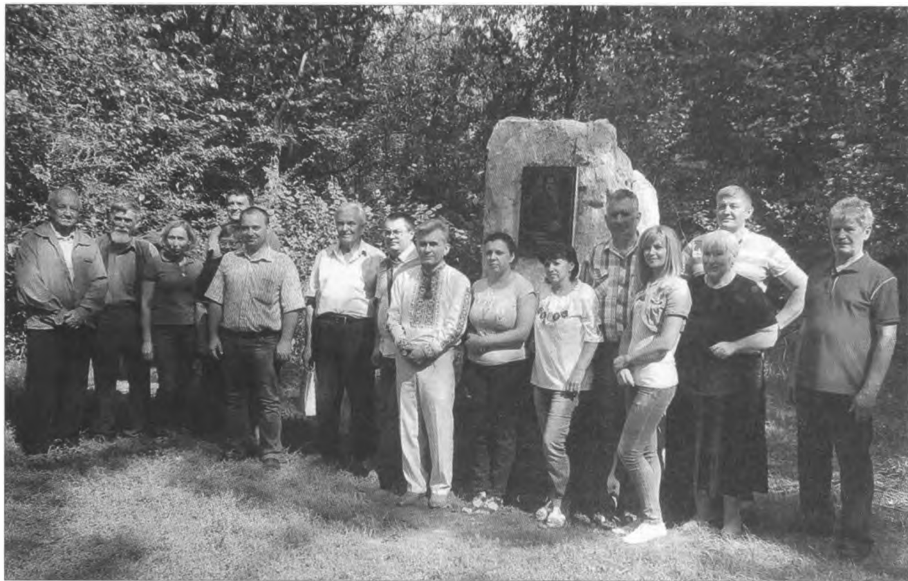
“Десант” кращезнавців Дніпропетровської, Донецької і Запорізької областей на місці колишнього “Дуба смерті” у Дібрівському лісі. 2016 р.