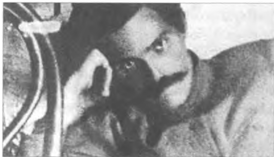
Нестор Махно в госпіталі