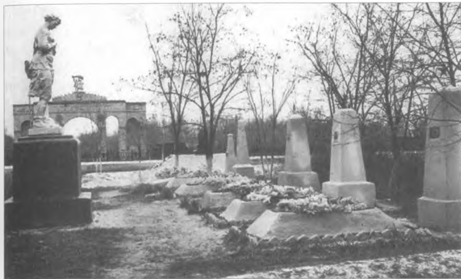
Братське кладовище в м. Гуляйполі, закладене Н. І. Махном восени 1918 р.

Другий районний з'їзд селян, робітників і повстанців зібрався 12 лютого 1919 року в с. Гуляй-Полі.