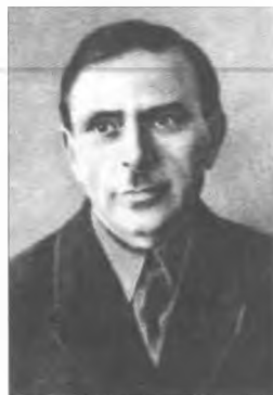
Віктор Федорович Білаш – начальник штабу Революційної Повстанської армії України (махновців)

«Позади стационанного здания играла гармошка, слышались заливастские выкрики: «Ой, яблучко, куда котисься, попадешь к Дерменжи, не воротишься».