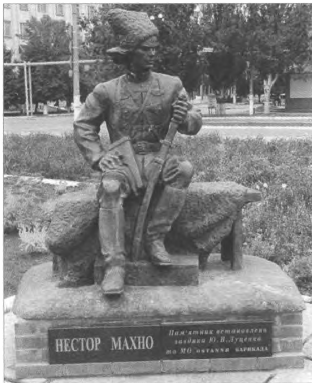
Пам'ятник «батькові» Махнові у м. Гуляйполі біля КСК «Сучасник»

... Не замовкає гомін на подвір'ї хати. Це знову прибилися, мов перелітні птахи, ті, хто цікавиться постаттю Нестора Івановича, хто пам'ятає про його «синочків» Вдовиченка, Куриленка, Марченка, Щуся, братів Каретників і багатьох інших.