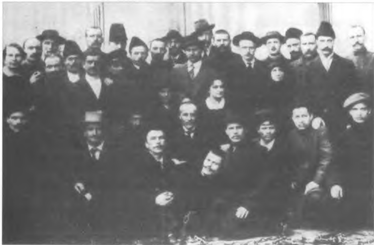
Визволені з Бутирської тюрми. 1917 р. Перший зліва в першому ряду Н. І. Махно