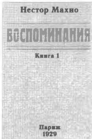
Обкладинка книжки 1 Н. І. Махно «Воспоминания»

1918 році на Україні), а потім, таємно, – у Брюссель, звідти – в Париж, де вже були дружина і дочка.