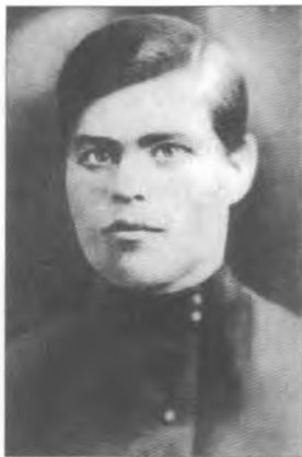
Нестор Махно. 1906 р.

З Московської Бутирської в'язниці Нестор вийшов у перших числах березня 1917 року і повернувся в рідне Гуляй-Поле. Тут він поринув з головою у громадсько-політичне життя села. Утворив селянську спілку, яка з середини 1917 року була перейменована на Раду робітничих і селянських депутатів. З середини серпня того ж року він розподілив землі поміщиків і колоністів між селянами з розрахунку на кожного члена сім'ї. На конфіскованих землях селяни Гуляйпільщини утворили сільськогосподарські комуни, ініціа-