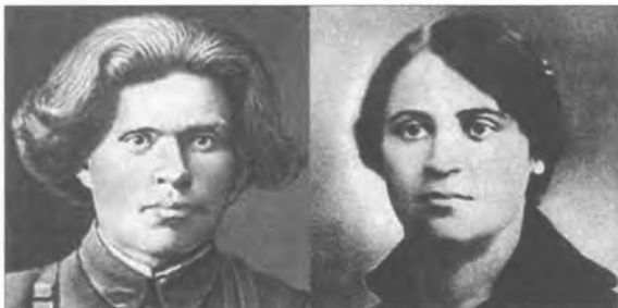
Н. І. Махно і Г. А. Кузьменко 20-ті роки ХХ ст.

1 вересня 1919 року повстанська армія дістала назву Революційна Повстанська армія України (махновців). Штаб армії очолив Нестор Іванович.