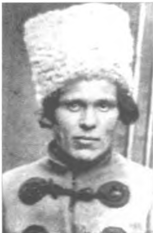
Командир Революційної Повстанської армії України (махновців) Н. І. Махно. 1919 р.

В середині січня 1920 року Махно і його повстанці були оголошені червоними поза законом через те, що відмовилися йти на польський фронт.