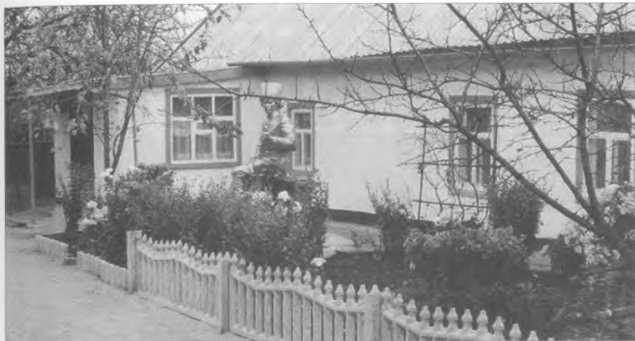
Пам'ятник Н. І. Махну на вулиці Трудовій, 144 в м. Гуляйполі. 2008 р.

Більше десяти років до будинку їдуть і йдуть. А нині потік гостей не вщуха і це ще тільки початок... У хаті затишно, прибрано, і тепло. На килимах ряхтять квіти, а на покуті у спальні справжній вівтар. Тут і фото, і документи, і особисті речі Галини Кузьменко. Коли-небудь хатина на вулиці Трудовій, 144 у м. Гуляйполі стане музеєм.