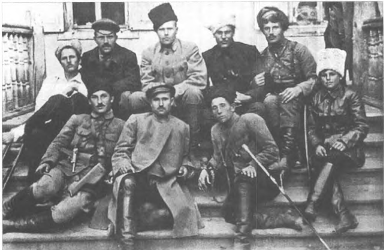
Махновський штаб. Н. І. Махно сидить перший справа