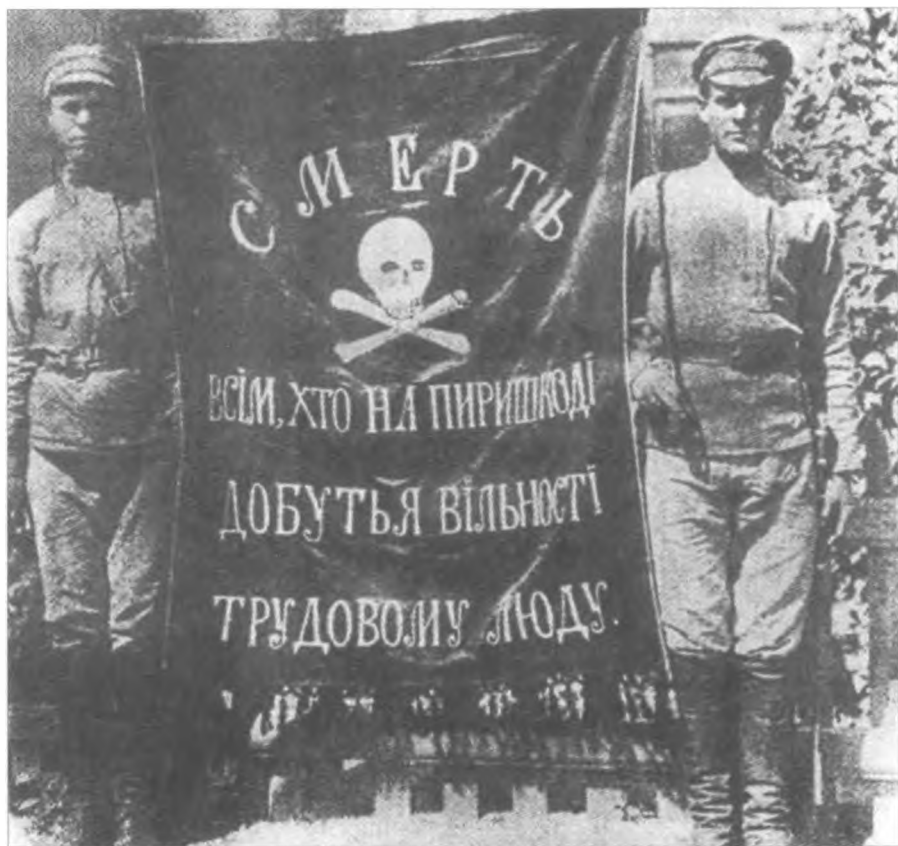
Один з прапорів махновської армії