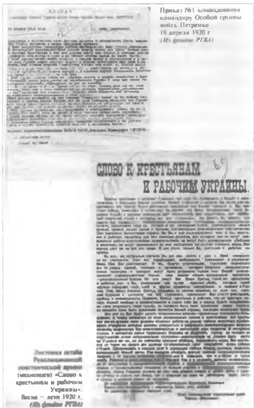
Листівка махновців. Весна-літо 1920 р.

26 вересня 1918 року невеликий загін смільчаків на чолі з Н.І. Махном розпочав збройну боротьбу проти окупантів і гетьманської варти. У жовтні 1918 року загін Махна вступив у Гуляй-Поле і ревком повідомив про відновлення Радянської влади.