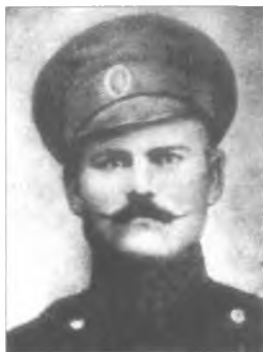
Омелян Іванович Махно