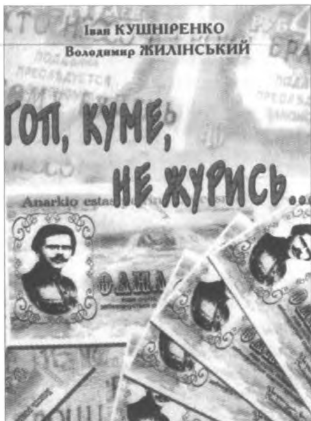
Обкладинка книжки «Гоп, куме, не журись»