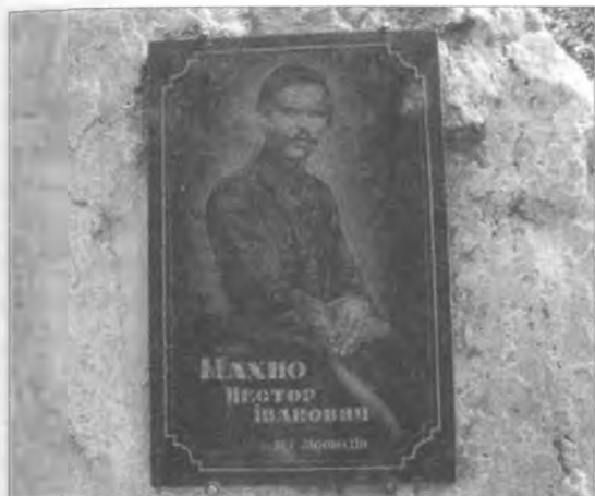
Меморіальна дошка на місці "Дуба смерті". 2017 р.

щастя він прийнявся і відчуває себе добре, як пам'ять про бойову історію цього краю.