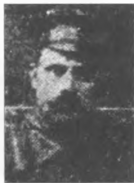
Григорій Іванович Махно

21 лютого 1920 року червоні розстріляли Савелія, який потрапив до них у полон.