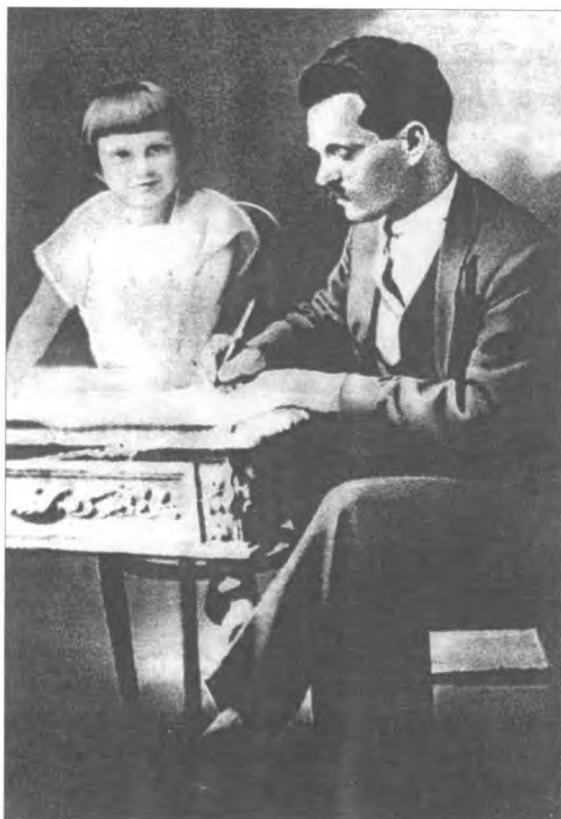
Н. І. Махно з дочкою Оленкою, м. Париж, кінець 20-х років

У 1927 році Нестор і Галина розлучилися.