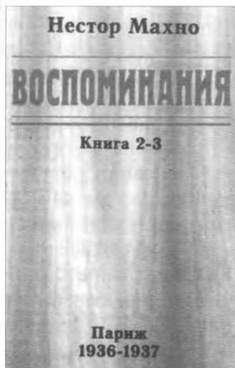
Обкладинка книжки 2-3 Н. І. Махно «Воспоминания»