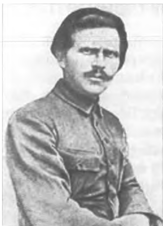
Н. І. Махно – творець махновської республіки

Установили фактический контроль батраков над помещичьими и кулацкими имениями и хуторами, подготавливая батраков к присоединению к крестьянам и к совместному действию в деле экспроприации всего богатства одиночек и провозглашению его общим достоянием трудящихся».