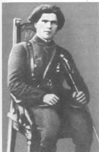
Н. І. Махно. 1918 р.

Начальник міської охорони (підпис нерозбірливий)».