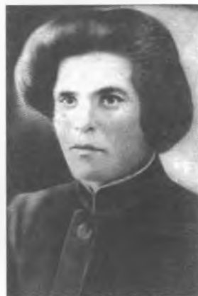
Нестор Іванович Махно. 1918 р.

23 січня 1919 року в селі Велика Михайлівка (Дібрівка) відкрився перший з'їзд селян і повстанців «вільного району».