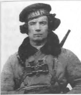
Федір (Феодосій) Щусь

На початку вересня 2016 року нам вдалося побувати на малій батьківщині Федора (Феодосія) Щуся. А запросив туди делегацію з міста Гуляйполя лікар - стоматолог за професією, історик, краєзнавець, природолюб за покликом душі, член наукового краєзнавчого товариства «Спадщина» з міста Покровська (Червоноармійська) Донецької області В. В. Кордюков взяти участь в урочистому відкритті нової експозиції «Повстанський рух Н. І. Махна на сході України», присвяченій революційно-повстанській діяльності Н. І. Махна, Ф. Щуся та інших бійців Революційно-Повстанської армії України (махновців) періоду громадянської війни в Україні в 1918 – 1921 роках.