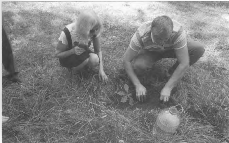
На місці “Дуба смерті” буде козацький дуб. Дібрівський ліс. 2016 р.

Був когось-то матросом Балтійського флоту і прославився там як непоборимий в спортивній боротьбі. Знав прийоми французької боротьби, бокса. Смыслит і в ліонському джуджитсу.