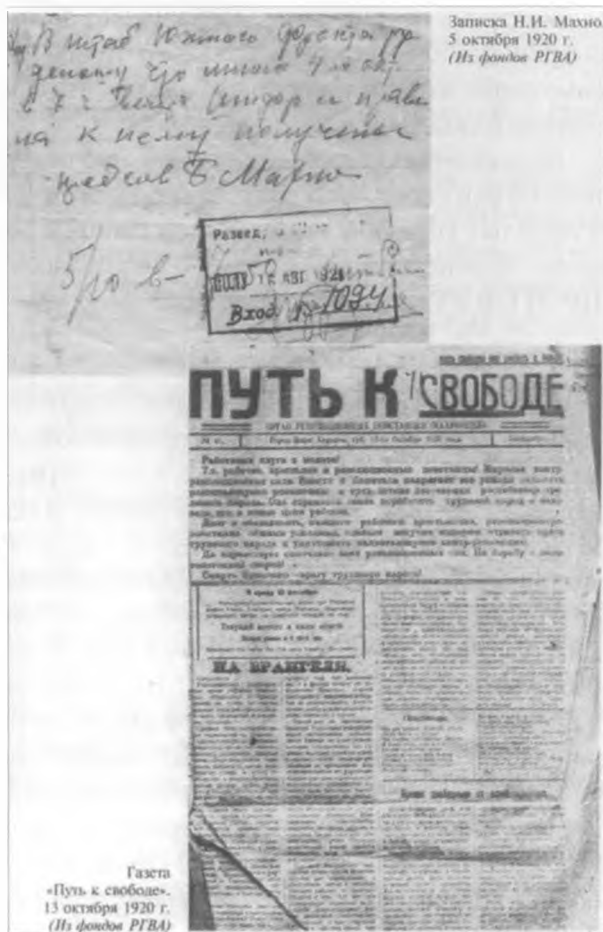
Газета "Путь к свободе". 13 жовтня 1920 р.

Махновщина стремится к светлой, счастливой, свободной, равноправной жизни и, — наконец: махновщина стремится к единению, во имя общего торжества идей, с городским пролетариатом, с рабочими, в моральной, а коль потребу-