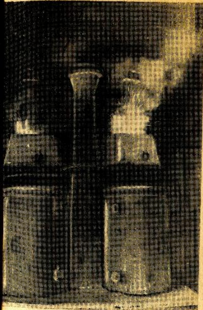
На снимке: электродуговой обогрев прибыльной части слитков.

Росту производства проката способствовали не только мероприятия, которые были проведены в сталеплавильном производстве, но и те нововведения, которые осуществлены непосредственно в прокатном цехе. На обжимном стане внедрена новая схема электропитания двигателя, что способствовало увеличению мощности, повышению производительности стана в горячий час до 2,9 тонны. На мелкосортных станах внедрены обводные аппараты и роликовые пропуска. На стане «550» удлинено раскатное полотно с задней стороны, внедрена наплавка валков твердыми сплавами, добавлена нитка шлепперов, пересмотрена калибровка. Все это позволило увеличить производительность стана за период с 1954 по 1956 год на 38 процентов. Применение кислорода для зачистки