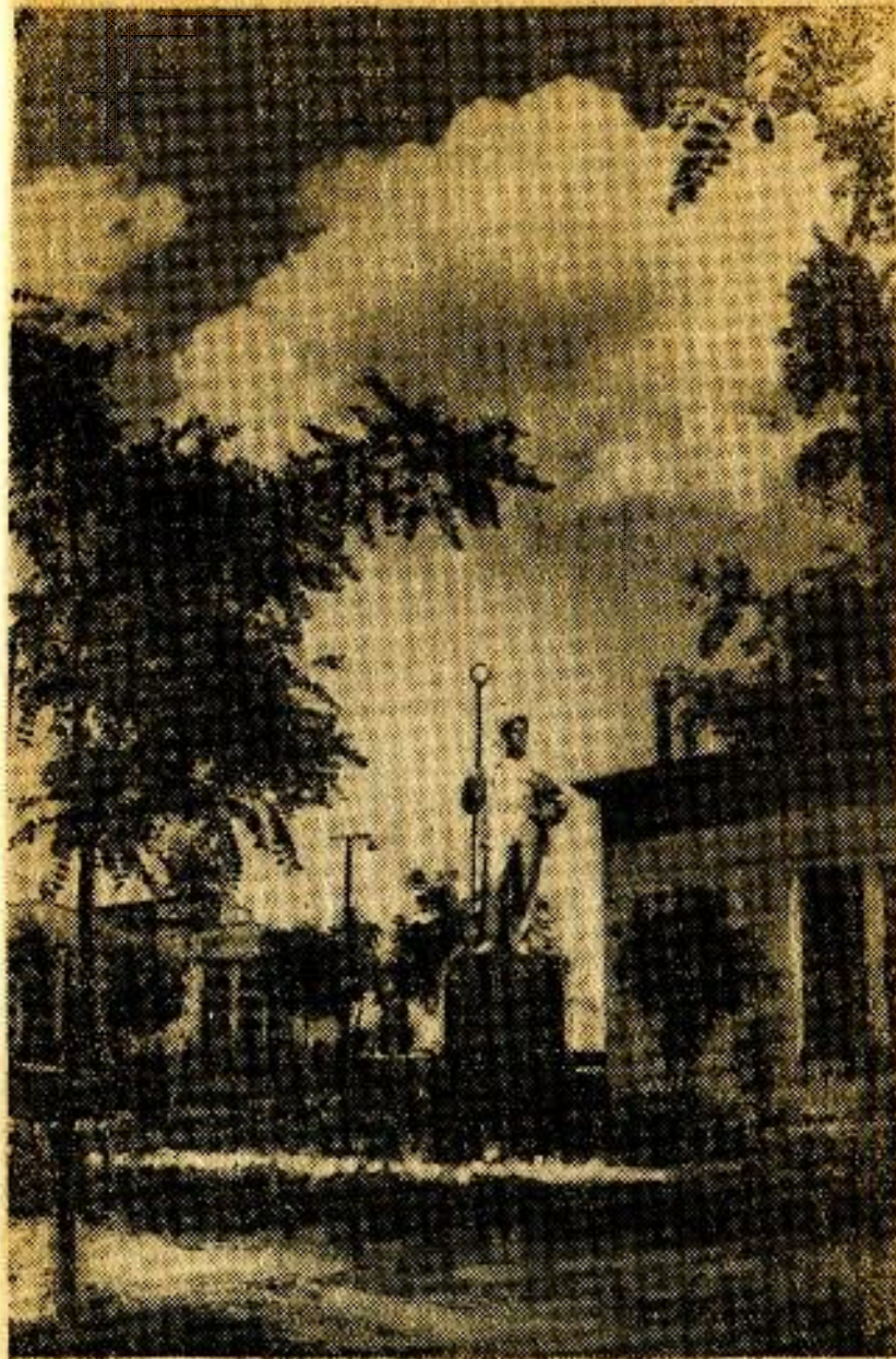
Завод «Днепрспецсталь». На территории завода.

В послевоенный период завод возрожден на совершен